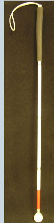
מקל לבן הסמל הבינלאומי ללקות ראייה

אם אתה רואה אדם עם לקות ראייה, שאל אותו אם הוא זקוק לעזרה. הקפד לדבר אליו בצורה ברורה ולתאר לו כל דבר באופן שהוא יוכל להבין אותך. אין טעם כמובן להסביר לו דברים עם תנועות ידיים או לומר לו תלך לשם. עליך לתאר לו את הדברים כך שהוא יוכל לתרגם אותם למעשים ולפעול על פיהם לדוגמה שלב מרפקך בידו - אם הוא זקוק לליווי - ואמור לו: " לפניך מדרגה אחת יורדת ולאחר מכן צריך לפנות שמאלה... ".