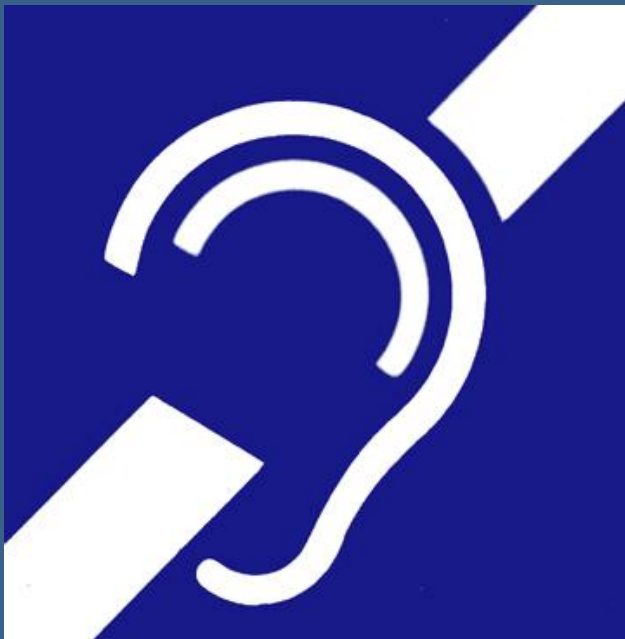
הסמל הבינלאומי למוגבלות בשמיעה

אל תהסס לבקש ממנו לחזור על דבריו במידה ולא הבנת אותו וזכור כי תמיד אתה יכול לדבר אתו באמצעות כתיבה על גבי נייר או באיפון או במחשב.